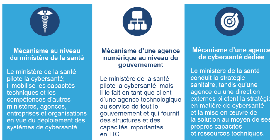
Figure 5 : Trois mécanismes de gouvernance

« Notre intention est de rendre opérationnelle la stratégie en matière de santé numérique, sous la conduite du ministère fédéral de la Santé et en nous focalisant sur la gouvernance. Nous sommes parvenus à la conclusion que le manque de gouvernance pourrait être le plus grand défi de l'application de la technologie au domaine de la santé. »