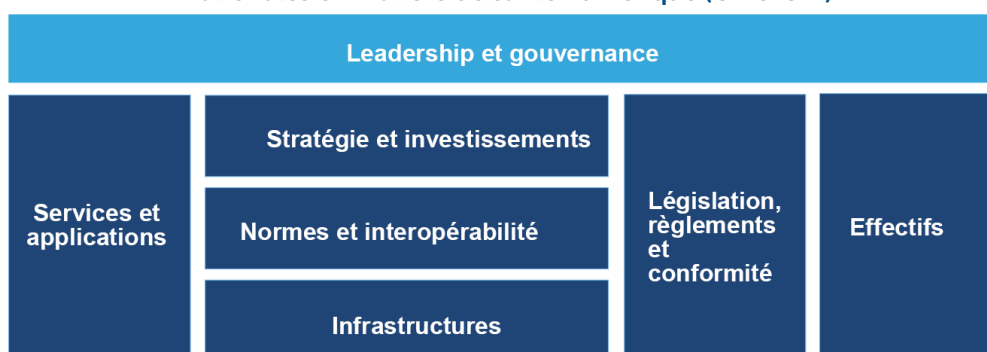
Figure 3 : Éléments du Guide pratique sur les stratégies nationales en matière de santé numérique (OMS-UIT)